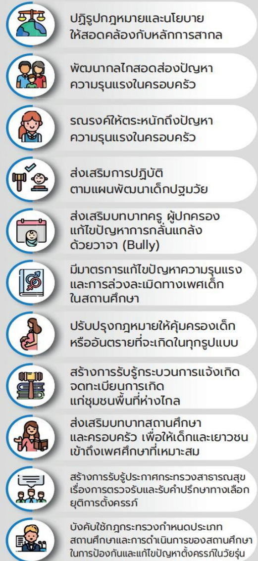
แผนภาพ 11 : กลุ่มเด็กและสตรี