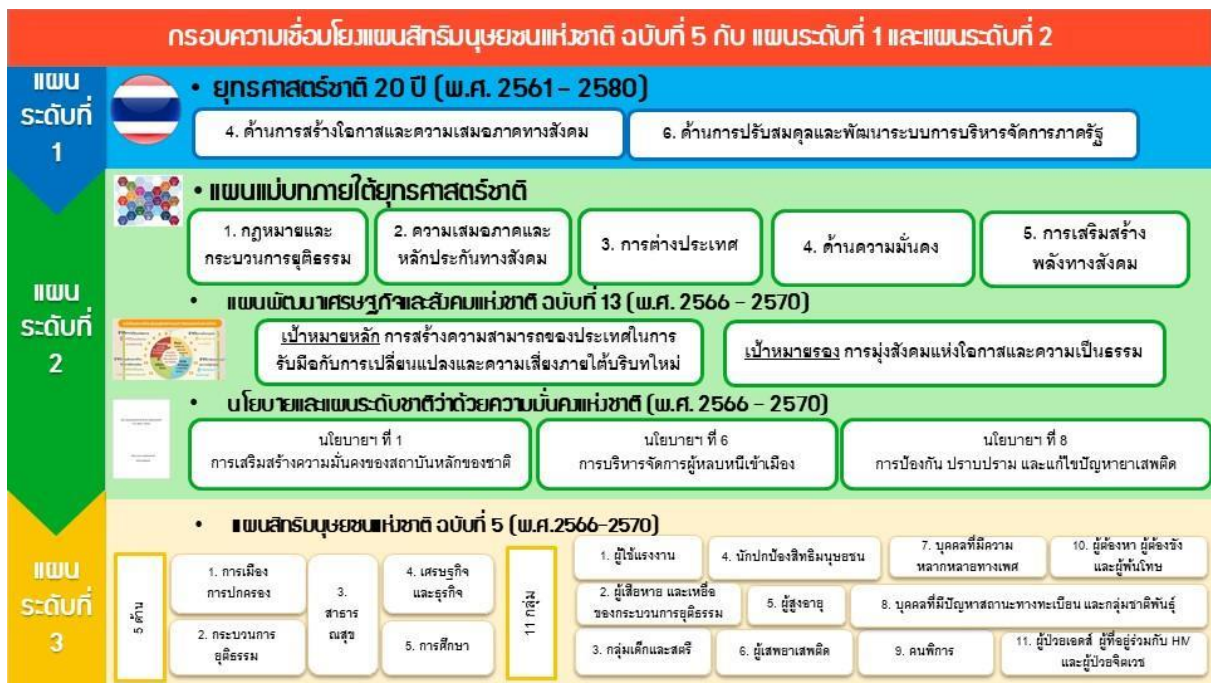
แผนภาพ 3 : กรอบความเชื่อมโยงแผนสิทธิมนุษยชนแห่งชาติ ฉบับที่ 5 (พ.ศ. 2566 - 2570) กับแผนระดับที่ 1 - 2

การจัดทำร่างแผนสิทธิมนุษยชนแห่งชาติ ฉบับที่ 5 (พ.ศ. 2566 – 2570) ใช้กรอบการวิเคราะห์ในประเด็นพื้นฐาน (issue-based) 5 มิติได้แก่ (1) มิติโครงสร้าง (2) มิติกฎหมาย (3) มิติการจัดสรรทรัพยากร (4) มิติความตระหนักรู้ และ (5) มิติสถานการณ์การแพร่ระบาดของโรคติดเชื้อไวรัสโคโรนา 2019 ที่ส่งผลกระทบต่อประเด็นสิทธิมนุษยชนในด้านต่าง ๆ โดยมียุทธศาสตร์ชาติ 20 ปี เป็นแผนระดับที่ 1 ซึ่งเป็นเป้าหมายการพัฒนาประเทศอย่างยั่งยืนตามหลักธรรมาภิบาล เพื่อใช้เป็นกรอบในการจัดทำแผนต่าง ๆ ให้มีความสอดคล้อง บูรณาการกันโดยการถ่ายทอดเป้าหมายและประเด็นการพัฒนาไปสู่แผนระดับที่ 2 ซึ่งเป็นกรอบแนวทางการขับเคลื่อนประเทศในมิติต่าง ๆ เพื่อบรรลุเป้าหมายของยุทธศาสตร์ชาติประกอบด้วยแผนแม่บทภายใต้ยุทธศาสตร์ชาติ แผนพัฒนาเศรษฐกิจและสังคมแห่งชาติ และนโยบายและแผนระดับชาติว่าด้วยความมั่นคงแห่งชาติตามแผนภาพ 3 : กรอบความเชื่อมโยงแผนสิทธิมนุษยชนแห่งชาติ ฉบับที่ 5 (พ.ศ. 2566 - 2570) กับแผนระดับที่ 1 - 2