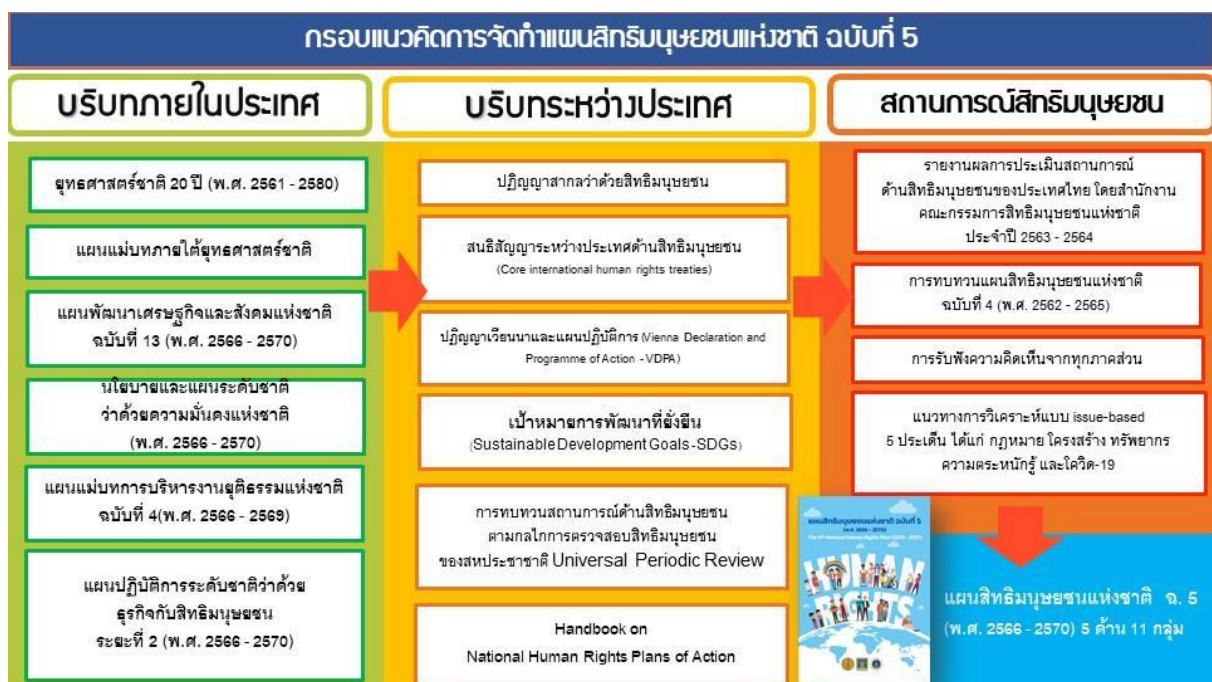
แผนภาพ 2 : กรอบแนวคิดการจัดทำแผนสิทธิมนุษยชนแห่งชาติ ฉบับที่ 5