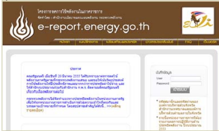
รูปที่ 1 หน้าแรกของ www.e-report.energy.go.th

หมายเหตุ: การขอ username และ password ในการเข้าระบบ