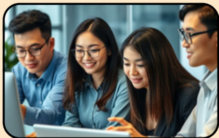
วิทยากรผู้ทรงคุณวุฒิ

(Digital Government Transformation with AI: AIGOV)