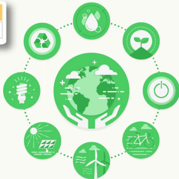
REF Graphic: "Designed by macrovector / Freepik"

ผู้เข้าอบรมต้องมีเวลาเรียนไม่ต่ำกว่า 80% จึงจะได้รับวุฒิบัตร จากสำนักงานพัฒนาวิทยาศาสตร์และเทคโนโลยีแห่งชาติ (สวทช.)