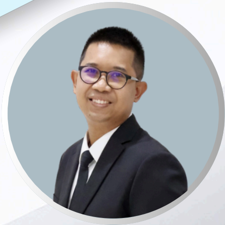
ดร. พัฒน์พงศ์ อมรวัฒน์ ตุลาการศาลปกครองกลาง

วันพุธที่ 17 มิถุนายน 2569 เวลา 13.00-16.00 น.