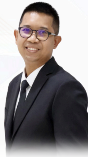
ดร. พัฒน์พงษ์ อมรวัฒน์ ตุลาการศาลปกครองกลาง

วันพฤหัสบดีที่ 18 มิถุนายน 2569 เวลา 13.00-16.00 น.