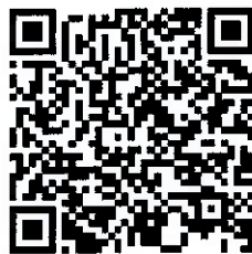
รายละเอียดงานอบรม